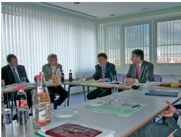
Bild1: Atmosphäre der Besprechung

Am Landratsamt Miltenberg wird das GIS-System W3GIS der AKDB verwendet. Eine wesentliche Förderung des GIS-Einsatzes an Landratsämtern bringt der neue – niedrige – Paketpreis für die Geobasisdaten der Vermessungsverwaltung. Eine Zusammenarbeit zwischen LRA und Gemeinden findet im Bereich GIS bisher nicht statt, ist aber vom LRA ins Auge gefasst.