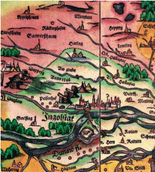
Bild 2: Ausschnittmontage aus Land- tafel 9 und 10 (verkleinert). Originaldrucke: Bayerische Staatsbibliothek München

Ortsdarstellung in Aufrissmanier. 3D-Stadtmodelle gab es also damals schon, nur eben in analoger Form. Was aber bedeuten die gegeneinander gerichteten Geschützstellungen und Feldlager westlich der Stadt? Ordnet man den Text »Anno 1546« dem militärischen Ereignis zu, so findet man die Belagerung Ingolstadts durch die evangelischen Fürsten im Schmalkaldischen Krieg. Philipp Apian leistet sich diese lokalhistorische Zutat, weil er das Ereignis in seiner Heimatstadt wohl selbst erlebt hat. Die Auseinandersetzungen der