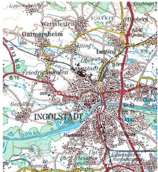
Bild 3: Topographische Übersichtskarte 1 : 200 000. Bundesamt für Kartographie und Geodäsie.

Ortsdarstellung in Aufrissmanier. 3D-Stadtmodelle gab es also damals schon, nur eben in analoger Form. Was aber bedeuten die gegeneinander gerichteten Geschützstellungen und Feldlager westlich der Stadt? Ordnet man den Text »Anno 1546« dem militärischen Ereignis zu, so findet man die Belagerung Ingolstadts durch die evangelischen Fürsten im Schmalkaldischen Krieg. Philipp Apian leistet sich diese lokalhistorische Zutat, weil er das Ereignis in seiner Heimatstadt wohl selbst erlebt hat. Die Auseinandersetzungen der