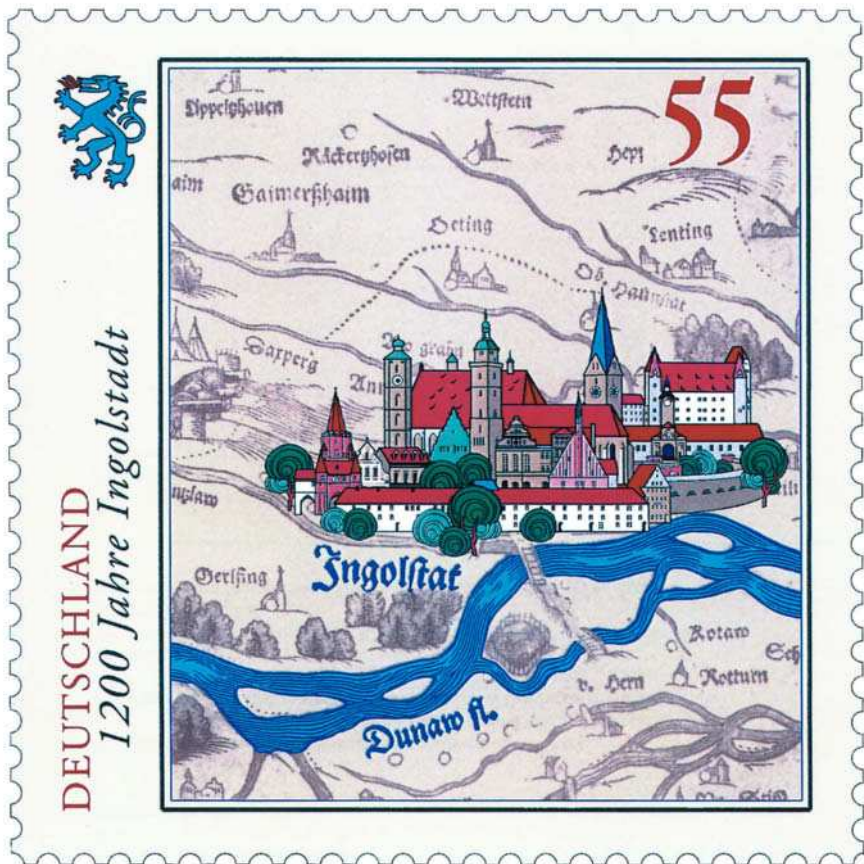
Bild 1: Vergrößerte Abbildung etwa im Originalmaßstab 1 : 144 000 der Apiankarte

das wissenschaftliche und kulturgeschichtlich hochbedeutsame Werk der Öffentlichkeit zugänglich machen.